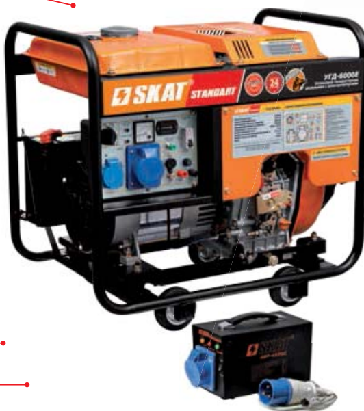
Блок автоматического запуска генератора AVR-6000D для моделей УГД-5300Е, УГД-6000Е поставляется отдельно.