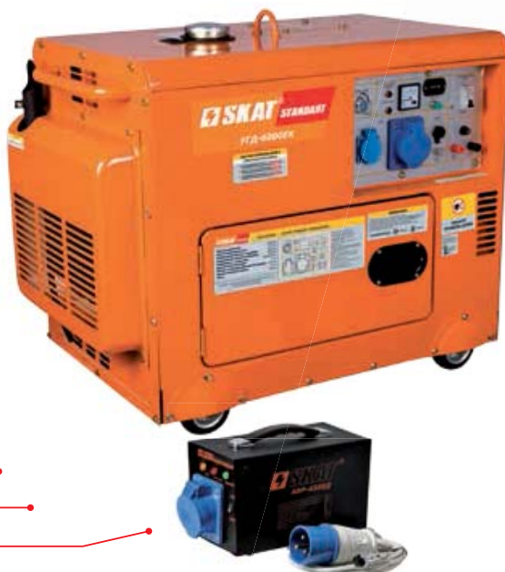
Блок автоматического запуска генератора AVP-6000Д для моделей УГД-5300ЕК, УГД-6000ЕК поставляется отдельно.

Эти установки отличает наличие шумозащитного кожуха, на что указывает буква «К» в названии модели. Кожух значительно снижает уровень шума работающей установки. Кроме этого кожух выполняет защитные функции. Модели генераторов, оснащенные кожухом, менее подвержены физическим повреждениям.